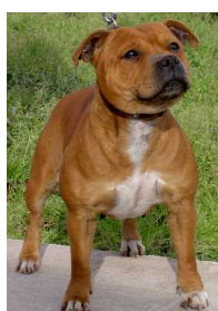
Staffordshire Bull Terrier